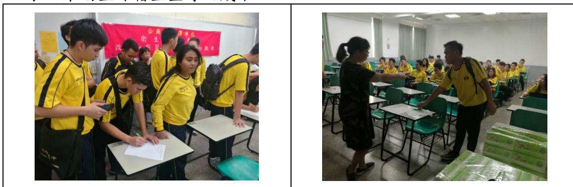
表 5 東南亞外籍生宣導之成果

其中 108 年 10 月 30 日針對崑山科技大學(外籍生)進行宣導，主要是因為東南亞地區生活習慣與台灣不同，特針對東南亞學生進行宣導。而因外籍學生中文程度有限，所以一開始先用宣導影片「衛生紙、面紙在水中分解情形之實驗」播放給學生觀看，結束後老師利用現場有的衛生紙與面紙直接告訴學生，2 種紙類通常包裝不同，紙質也不相同、使用的地方也不太一樣，外籍生因無法理解學習單上的中文，故老師透過幾個簡單的問題來確認學生是否理解宣導內容，本次宣導結束前，學生確實能夠回答老師哪一種紙類(衛生紙)是可以丟入馬桶，哪一種(面紙、其他物品)不行，正確區別與分類是 5S 之最重要之基本觀念。