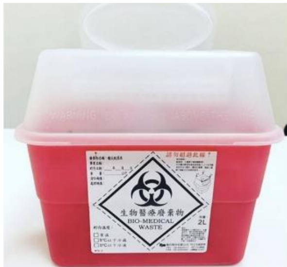
圖 3 攜帶型生物醫療廢棄物盒