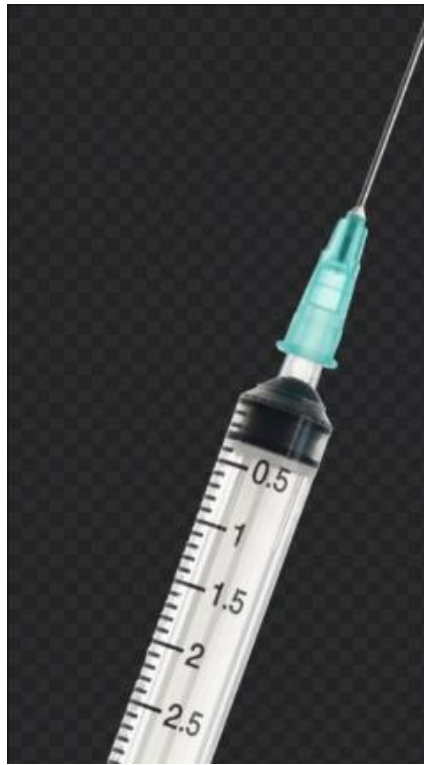
圖 2 回收針頭