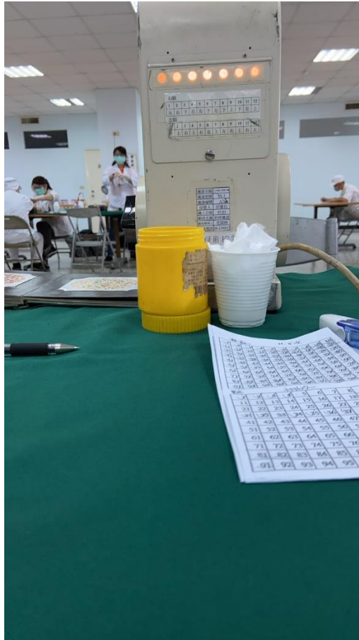
圖 6 回收儀器使用後的酒精棉片