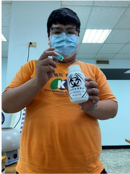
圖 4 蒐集針筒