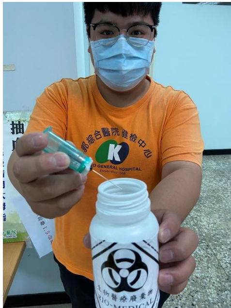
圖 5 立即將針頭投入醫療廢棄物專用罐