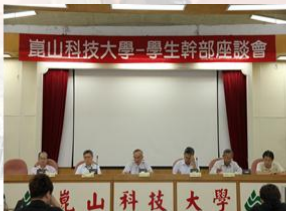
學生自治幹部座談會由校長蘇炎坤主持

為了提供學校與學生問題反應的平台，本次 101 學年第 1 學期「學生自治幹部座談會」於 101 年 11 月 5 日 08:30 時，假人文一館 5 樓崑山會議廳舉行，參與的師生達 200 人次以上，藉由學生的提案，讓學校更了解學生的需求並給予適時的協助。會議當中校長表示，學生除在定期的自治幹部座談會外，仍然需要靠平時的溝通與協調最重要。因此，未來學生若有任何問題都可隨時向相關單位提出反應，相關單位都會立即的接受並實際勘查後，給予適切的回應與處理。