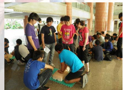
學生 CPR 實際操作演練