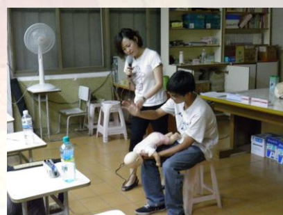
講解嬰兒哽咽 CPR 急救步驟