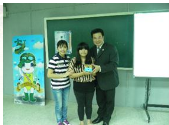
講師及衛保組組長頒贈有獎徵答獲獎同學

為提昇學生對於交通安全的重視以及學生團體保險的認識，衛生保健組於 101 年 11 月 7 日(星期三)15:30 時，假軍訓教室辦理『班級衛生幹部研習-認識學生平安保險及交通安全』，特別邀請三商美邦人壽保險公司謝政道經理擔任講師，活動計有 112 人參加。透過生動活潑的講習讓師生更瞭解學生保險，讓交通安全的注重觀念深植各班，不僅收到很好的訓練效果，並獲得廣大迴響。