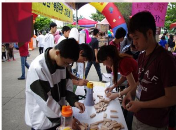
闖關活動「一起疊疊樂」

學輔中心辦理「生涯規劃探險工作坊」，並結合本校 47 週年校慶園遊會活動，先後於 101 年 4 月 28 日及 5 月 3 日兩天，以外展服務及個別諮詢等方式發掘學生在興趣、能力、價值觀等不同向度的發展，滿足其生涯規劃方面的需求和期待，並達到寓教於樂的效果，針對本校及南區區域教學資源中心之各夥伴學校學生，分別在校慶園遊會攤位和設計三館前廣場進行闖關活動。參加人數達 196 人，提供機會自我省思性向、自己所擁有的能力和嚮往的人生價值，提醒學生理財規劃的觀念，並協助他們去思考如何做出更好的生涯決策。