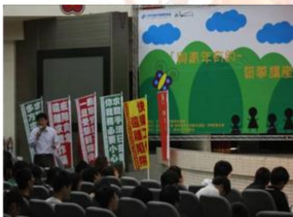
邀請青輔會宣講大使林皆興教授擔任講師

為加強服務青年及輔導青年，本校於 101 年 5 月 16 日(星期三)在行政中心小禮堂承辦青輔會「101 年與青年有約-築夢講座宣講大使場」，特別邀請青輔會宣講大使林皆興教授擔任講師，參加學生計有 565 人次，宣導青年政策施政理念及措施與分享實踐經驗，並與青年朋友面對面交流對話，建立青年與政府間之溝通平台，增進對青輔會政策瞭解，藉以激勵青年投入公共事務，關懷服務鄉土，回饋國家社會。