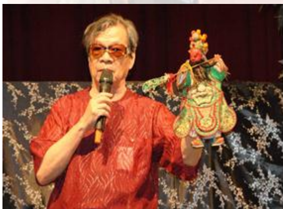
邀請布袋戲國寶-黃俊雄老師蒞校講演

為了推廣傳統藝術的延續，行政院文建會文化資產總管理處籌備處與本校合作舉行「101 年重要傳統藝術保存者暨無形文化資產推廣校園合作計畫-黃俊雄布袋戲講座及示演」，於 101 年 5 月 23 日(星期三)假行政中心 2 樓小禮堂實施，參與學生達 500 人次以上，同學們對此文化饗宴熱烈參與，本次活動讓學生對於傳統藝術文化有更深入的了解，並培育人文與藝文欣賞之內涵。