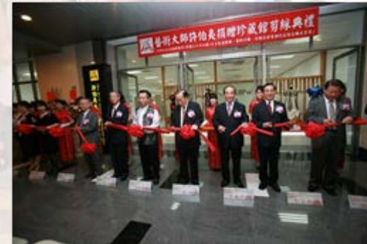
長官及來賓藝術大師許伯夷珍藏館剪綵