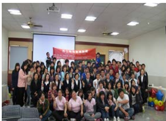
陽光活力志工行教育訓練合影

為鼓勵社會大眾、青年學子投入社會關懷與教育服務工作，培養「施比受更有福、予比取更快樂」的觀念，「陽光活力志工行—志工特殊教育訓練」於101年3月24~25日假崇禮文教基金會正式舉行，參加學生計有150人次以上，課程特別邀請到嘉南藥理科技大學李麗雲教授講授「社會資源及志願服務」與「社會福利概述」，還有百世文教基金會秘書長江建勳老師講授「說話的藝術」等精彩內容，期許學生具有「懷抱奉獻自己、照亮別人」之德操，踴躍投入志願服務行列，積極散播志願服務種子，共同協助社會服務工作及增進社會祥和而努力。