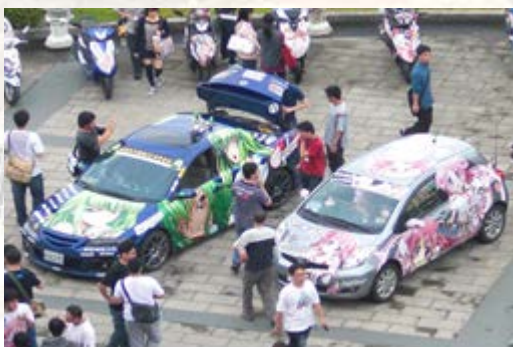
動漫迷提供愛車舉辦的痛車靜態展