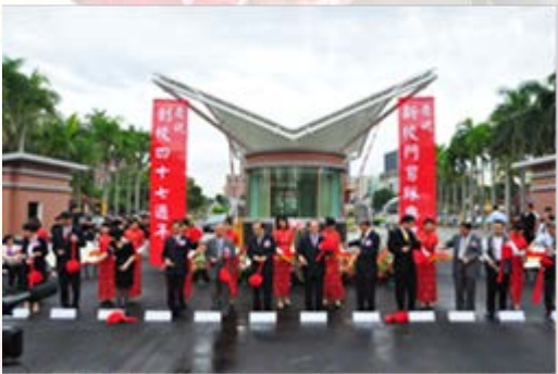
長官及來賓新建校門剪綵