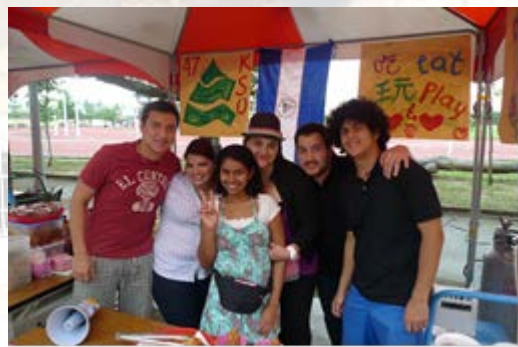
校慶園遊會瓜地馬拉國際生攤位