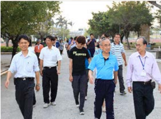
校長及學務長帶領大家快樂健走

為推廣全校健走運動之風氣，提倡教職員生養成規律運動之生活型態，衛生保健組於 101 年 3 月 20 日~101 年 6 月 5 日在體育館前辦理『大手牽小手-崑山師生一起來健走』校園健走活動。活動計有 80 位教職員生參加，將持續 12 週，透過健走活動激發師生對健康體位的重視，建立持之以恆校園健走的方式來增加運動量，不僅可以培養喜愛運動風氣，增加彼此情誼，落實維持健康體位之目標。