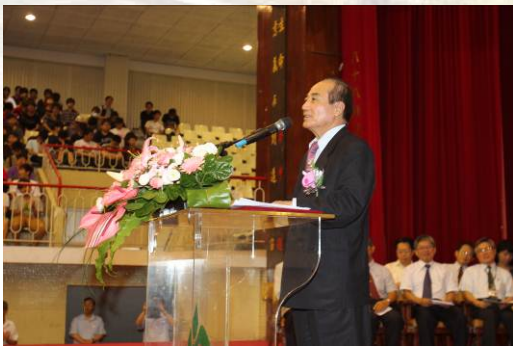
立法院長王金平蒞校致詞