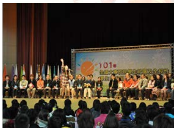
榮獲全國大專院校學生社團評鑑績優獎頒獎

教育部為促進大專校院學生社團活動進步與發展，101年3月24日至25日於玄奘科技大學舉辦「101年全國大專校院學生社團及全校性學生自治組織評鑑暨觀摩活動」，本校學生社團「手工藝社」與「電子系學會」分別榮獲「學藝類組績優獎」與「綜合類組績優獎」，期望藉由社團評鑑暨觀摩活動，提昇社團活動及經營品質，以發揮學生參與活動之教育功能。