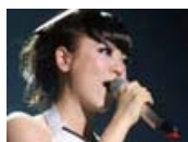
丁噹 演唱會初體驗 師兄五月天助陣