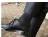
傳統襪廠轉型, 靠機能襪反攻大陸