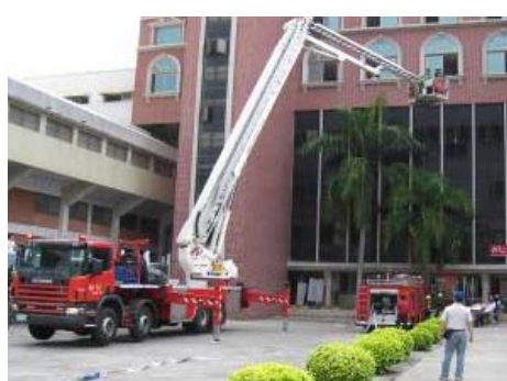
大型雲梯車接應高樓層受困學生