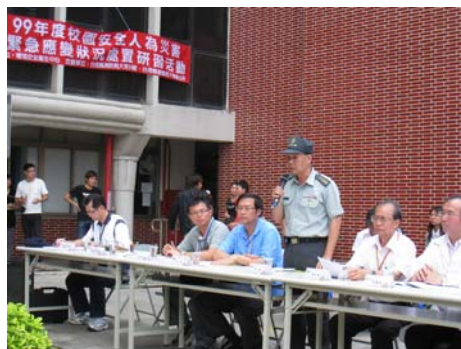
軍訓室主任說明執行構想及狀況設定等事項