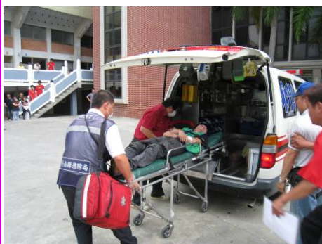
灼傷學生經初步處理後立即送醫診治