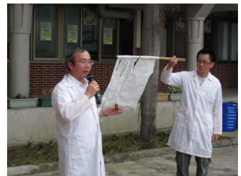
環安中心主任示範硫酸侵蝕布料情形