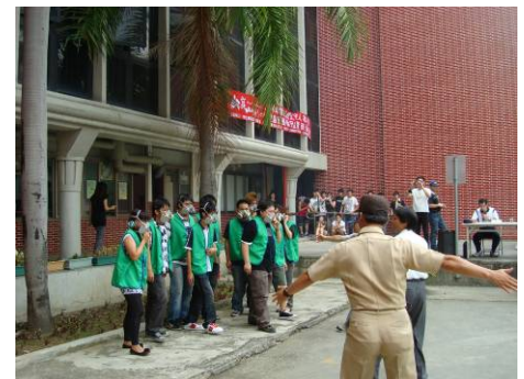
同學佩帶防毒面具進行疏散