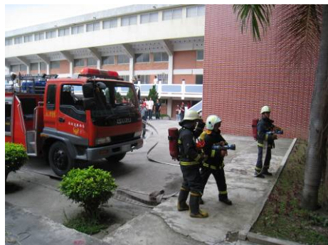
消防單位協助處理化學藥劑外洩狀況