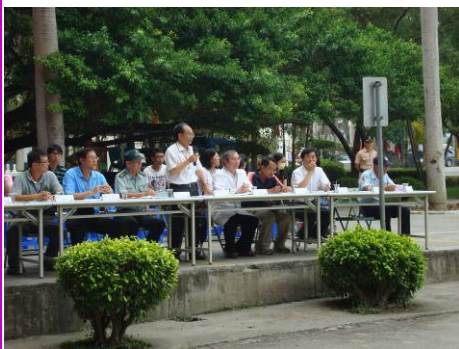
學務長致詞並詳盡說明研習目的

本校於 5 月 26 日（星期三）14 時，假工程三館前廣場辦理「99 年度校園安全人為災害緊急應變狀況處置演練研習活動」，考量實際狀況加以設定發生機率較高之人為緊急意外事故，計有歹徒進入校園滋事、實驗室化學藥劑外洩、學生遭受化學藥劑灼傷、高樓層學生緊急狀況逃生求助等狀況，加以驗證本校「校園災害管理實施計畫」之「減災」、「整備」、「應變」、「復原」各階段處理程序與具體作為是否周延可行。本次活動結合學務處、軍訓室、環安中心、總務處、高分子材料系、警衛室、大灣消防隊及大灣派出所等單位共同參與演練，藉以驗證校內各單位處置作為是否迅速確實；校外支援單位是否及時協助處理各項事故，透過實況演練強化各單位協調整合與危機處理能力，使校園災害防救體系更加健全周妥。本次演練活動為求接近實況，協調校外單位支援警備車、消防車、救護車、大型雲梯車及煙霧器等重型機具及警政、消防、救護人員，本校相關主管配合演練進行各項處置說明，各系助理及學生代表均到場觀摩，期能充分發揮研習活動的實效。（歡迎至軍訓室網頁之「檔案資源」下載或閱覽本次研習手冊及相關宣導資料）