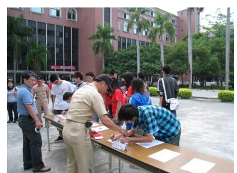
參加研習同學簽到情形